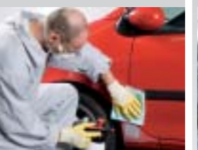
16. Mit Silikonentferner reinigen und mit Sontara® SPS™ Entfettungstuch gründlich nachwischen.