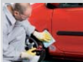
9. Mit Silikonentferner reinigen und mit Sontara® SPS™ Entfettungstuch gründlich nachwischen.