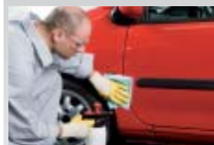
2. Großflächig mit Silikonentferner reinigen und mit Sontara® SPS™ Entfettungstuch gründlich nachwischen.