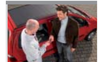
23. Das Ergebnis: Einfach. Brillant.