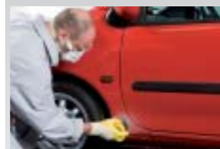
3. Schadstelle mit Excenterschleifer P180-240 ausschleifen.