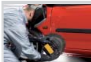
19. Trocknen mit dem UV-Gerät.