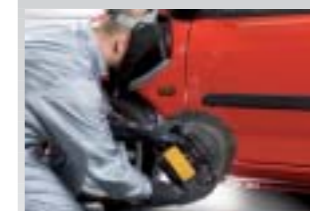
7. Trocknen mit dem UV-Gerät.