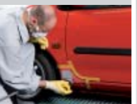
14. Mattieren der Randzone mit feinem Schleifpapier (z.B. 3M Trizact P3000).