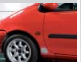
15. Mattierte Fläche.