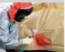
17. Basislack auftragen und matt abblühen lassen.