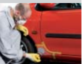
13. Schleifen; Trockenschliff mit P400.