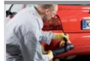
21. Randzone nach ausreichender Trocknung wenn nötig mit geeignetem Schleifmittel egalisieren (z.B. 3M Trizact P3000) und anschließend polieren.