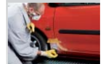
8. Schleifen mit Excenterschleifer P180-240 und Nachschliff P320.