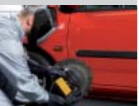
12. Trocknen mit dem UV-Gerät.