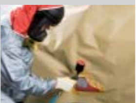
11. Auftrag von Permasolid® UV Starlight Grundierfüller 9000 in 1,5 Spritzgängen (1 Arbeitsgang).