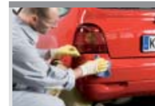
22. Nachpolieren mit Poliertuch.