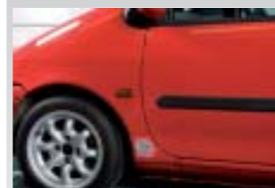
4. Geschliffene Reparaturstelle.