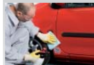
5. Mit Silikonentferner reinigen und mit Sontara® SPS™ Entfettungstuch gründlich nachwischen.